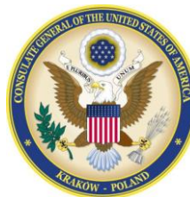
sesja pod patronatem